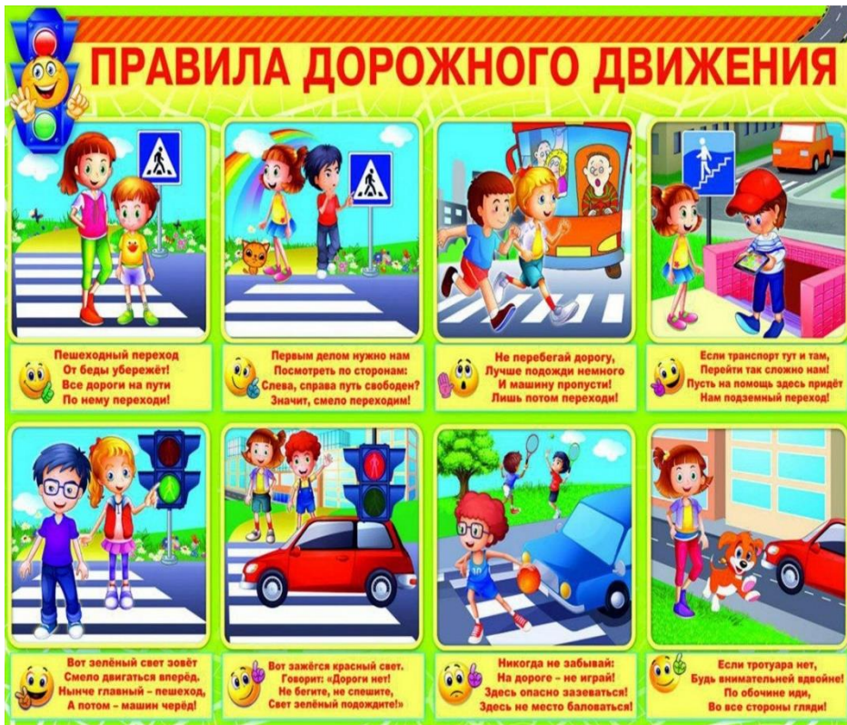
Рисунок 2. Макет стенда на сентябрь