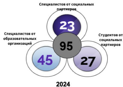
Количество специалистов образовательных организаций, включенных в реализацию проекта