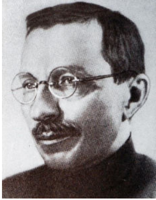
Антон Семёнович Макаренко

«Должен быть коллектив воспитателей, и там, где воспитатели не соединены в коллектив и коллектив не имеет единого плана работы, единого тона, единого точного подхода к ребенку, там не может быть никакого воспитательного процесса»