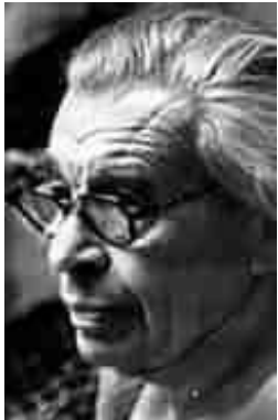
Даниил Борисович Эльконин