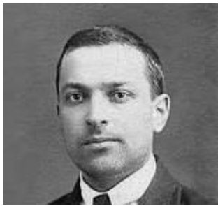
Лев Семёнович Выготский психолог