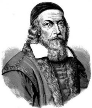
XVII век Ян Амос Коменский

священники, монахи - основы грамоты и религия, мастера-ремесленники - профессии, специально обученные люди - университеты